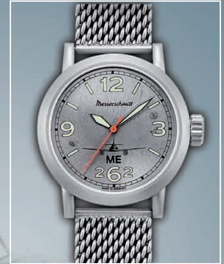
ME262-Aero 590,- Euro

ausgestattet mit einem anspruchsvoll gefertigten Milanaise-Stahlband