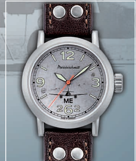
ME262-Aero-L 540,- Euro